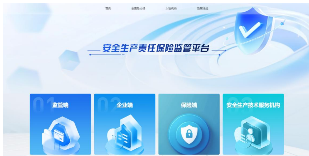
【安全生产责任保险监管平台综合页面】